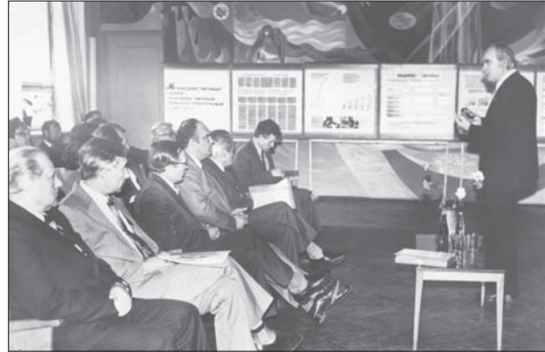
Я.С. Підстригач розповідає про досягнення співробітників Інституту учасникам Всесоюзного семінару. Львів, 1981 р.

Нові узагальнені математичні моделі взаємозв'язаних процесів різної природи показали, що для успішного проведення на їх основі якісних і кількісних досліджень механічної поведінки неоднорідних тіл необхідно застосовувати сучасні математичні методи і засоби математичного моделювання. Цій актуальній проблемі він надавав особливого значення протягом усієї своєї наукової діяльності. Для її вирішення необхідно було сформувати потужний, вихований на цих ідеях науковий колектив. На додаток до цього, у Я.С. Підстригача було велике бажання відновити у Львові сучасні математичні дослідження, якими Львівський університет був відомий у світі в довоєнний період, і проводити їх також в академічному середовищі. Тому з метою формування такого колективу відразу ж після створення в 1962 р. відділу термоміцності він постійно і наполегливо працював над підготовкою спеціалістів високої кваліфікації — математиків, механіків, фізиків. Успішна робота в цьому напрямі дала